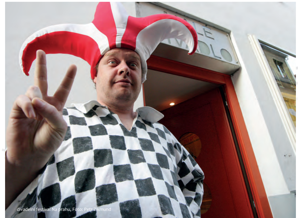
divadelní festival Na prahu

6. Beim Magistrat der Stadt Ceske Budejovice (Budweis) sind es gerade die MitarbeiterInnen der Kulturabteilung, die einerseits die behördlichen Selbstverwaltungsaufgaben und andererseits die kreative Herangehensweise in der Vorbereitung und Kommunikation der Veranstaltungen bewältigen muss.