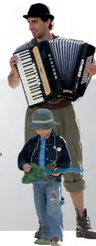
divadelní festival Na prahu, Foto: Petr Zikmund

Vorwort: František Štangel KM Projekte Befragung: Finanzkrise in der Kultur