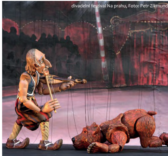
divadelní festival Na prahu

Daher sind jene Kunst und Kulturbereiche am meisten betroffen, die auf dieses private Sponsoring angewiesen waren.