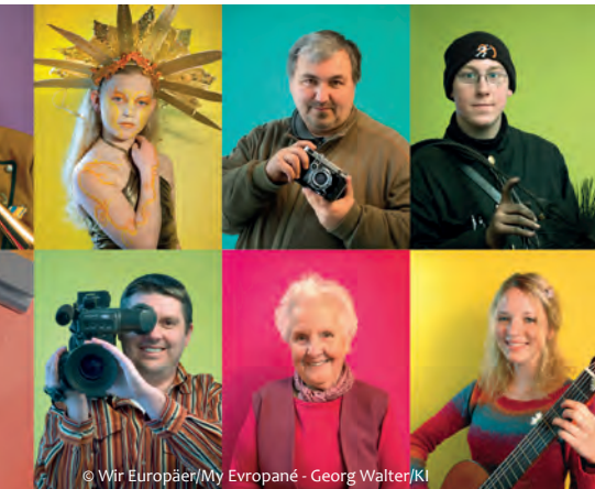
© Wir Europäer/My Evropané - Georg Walter/KI

Die vernissage findet am Donnersta, dem 25.6.2009, ab 18:00 Uhr im Park der Burg und des Schlosses Jindřichův Hradec statt. ( http://www2.waltergrafik.at/start/index.php?id=8 )