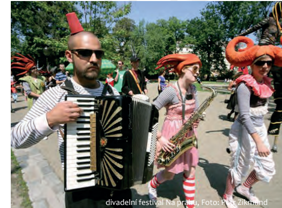
divadelní festival Na prahu, Foto: Petr Zikmund

6. Im Verlag Torst arbeite ich alleine, aber ich arbeite mit anderen Gewerbetreibenden zusammen.